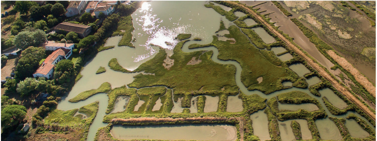
Les Abots, derrière le port

L es élections du 15 mars dernier ont permis l'élection du nouveau Conseil municipal. Une période inédite, riche d'enseignement, a repoussé son installation au mois de Juin.