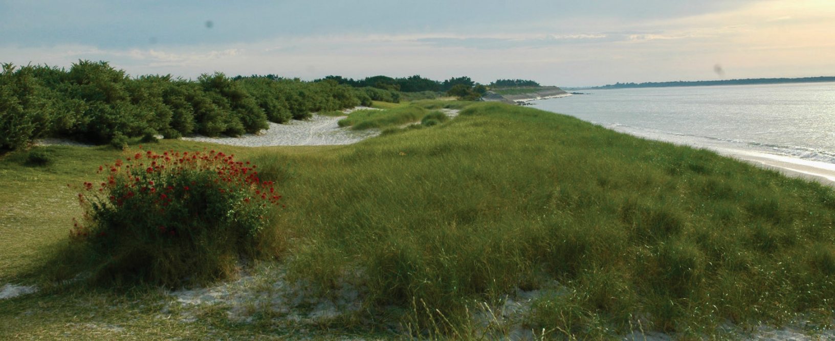
Les Sailloux au printemps